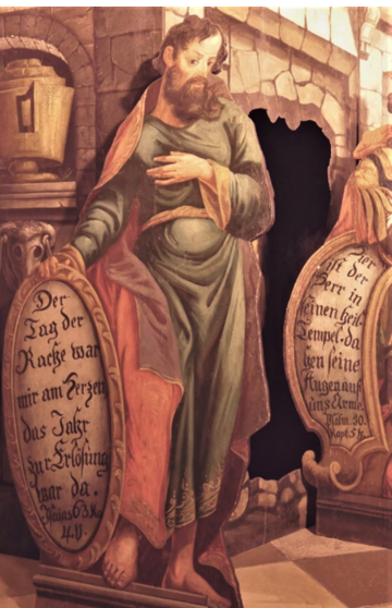
Bild links: Prophet Jesaja und Spruchtafel Davids; Bild rechts: Mose mit der Schlange, Jeremia.

König David trägt die Spruchtafel: „Hier ist der Herr in seinen heil. Tempel. da (se)hen seine Augen auf uns Arme. Psalm. 30. Kapt. 5 V.“ Richtigerweise ist hier aus Psalm 11,4 (10,5) zitiert, wo es um einen Verfolgten geht, der in Gott seine Zuflucht findet. König David (1000-960 v.Chr.) gilt nicht nur als Vorfahre von Jesus, „dem Sohn Davids“, sondern auch als Psalmendichter und Harfenspieler.